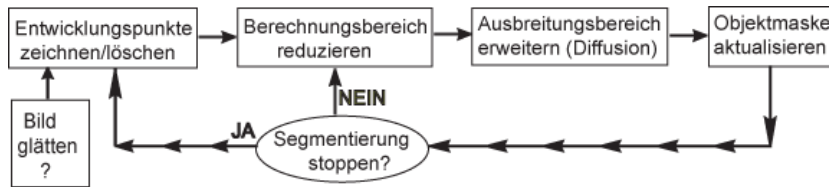
Abb. 1. Ablauf

getragen werden. Die Diffusion beschreibt die Änderungen in der Ausbreitungsmaske s = s(t; x, y, z) aufgrund der Daten im Ursprungsbild u = u(x, y, z) in jedem Zeitschritt t :